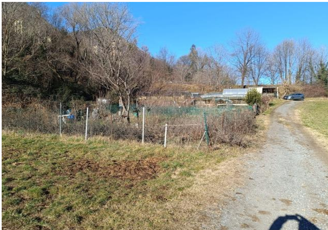
Foto D'INSIEME DEI LOTTI