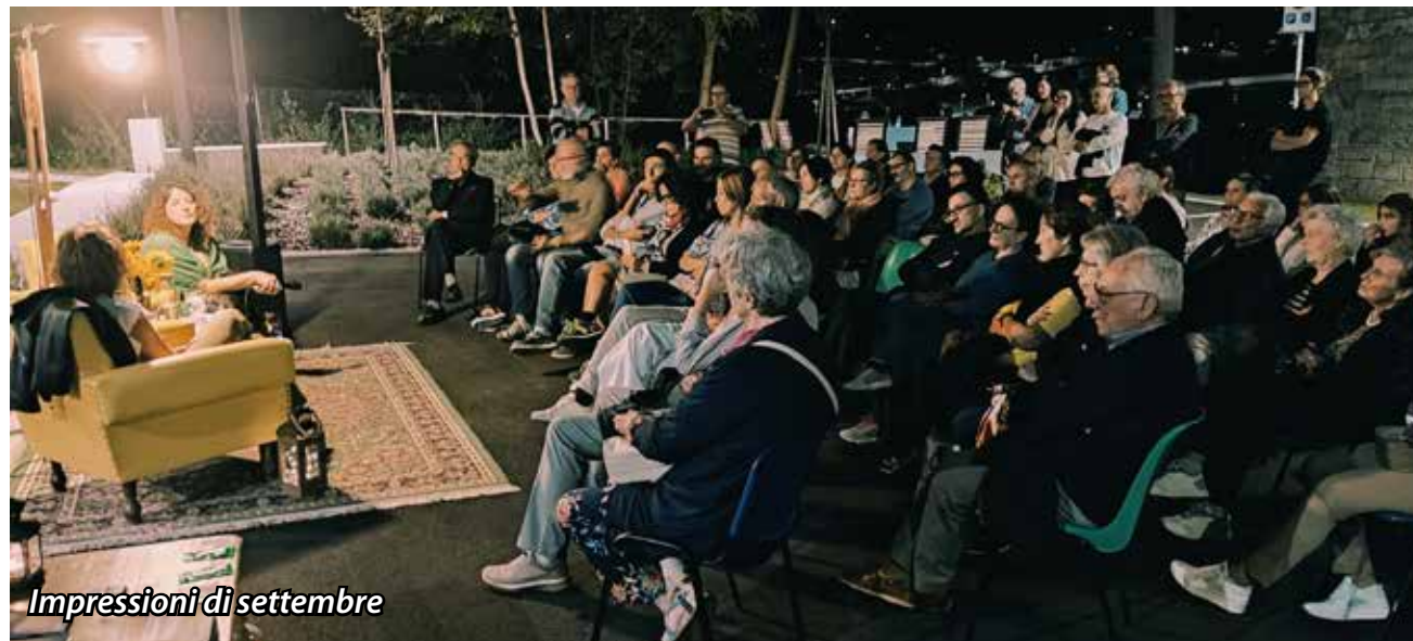
Impressioni di settembre

L'ultimo mercoledì di ogni mese ci ritroviamo in biblioteca per le "letture e laboratori in biblio" : storie