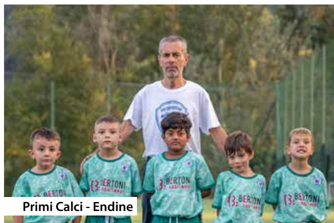
Primi Calci - Endine