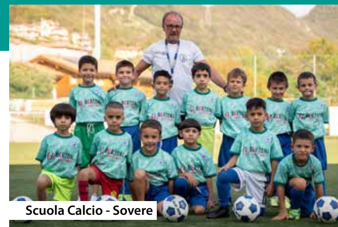
Scuola Calcio - Sovere