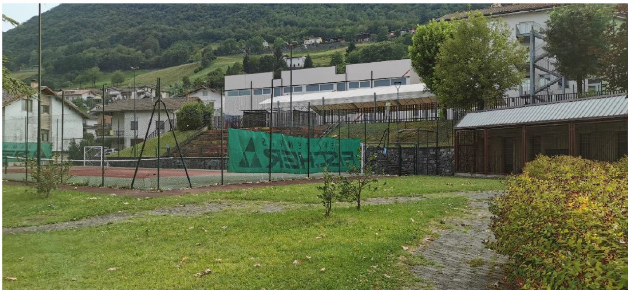
Foto Campo tennis con annessi spogliatoi