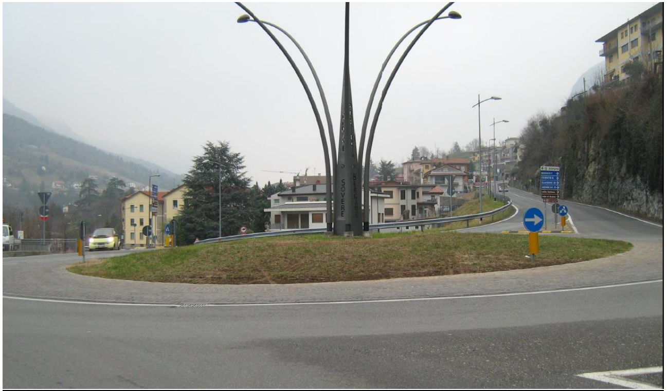
Lotto n° 3: