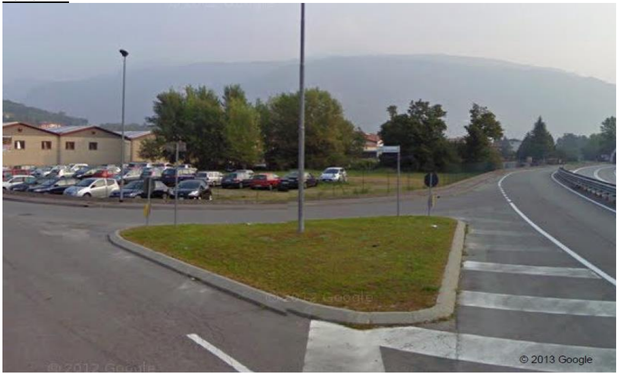
Lotto n° 5