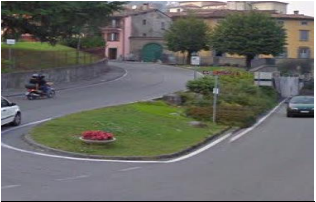
Lotto n° 4