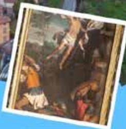
Chiesa di San Martino