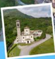
Santuario Madonna della Torre