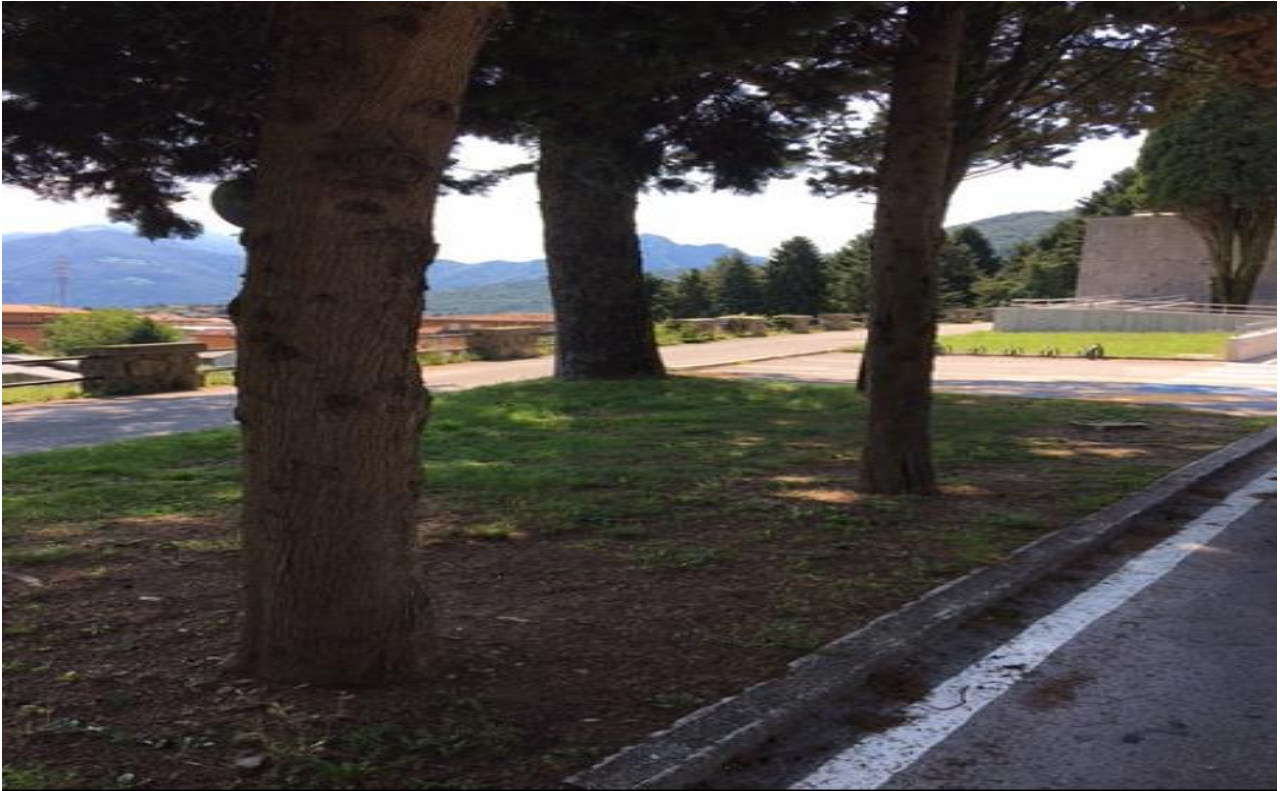
Foto: area installazione chiosco